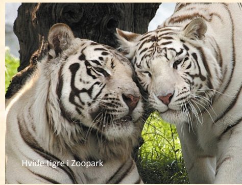
Hvide tigre i Zoopark