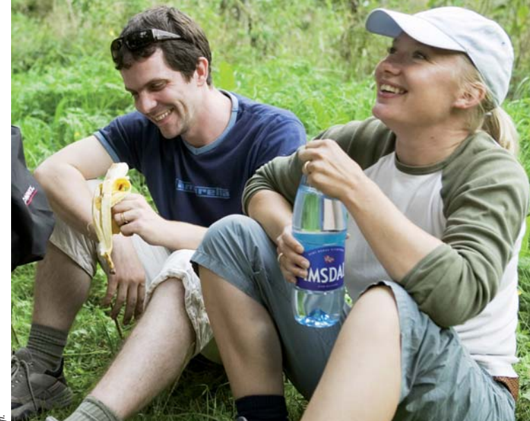
Tekst: Sigris Wøhr - Layout: Bjørn Bekke - Foto: DT Fotoarkiv m.fl.