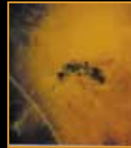
Inkluser af Flue