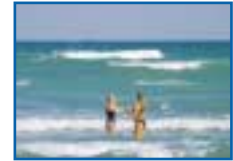
3 Råbylille Strand