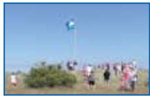
Die Blaue Flagge