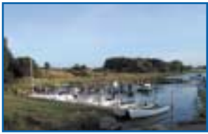
6 Badebrücke bei Skåninge Bro