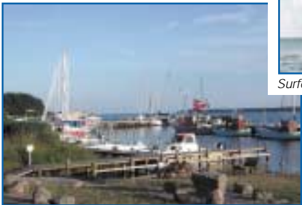
5 Hårbølle Havn