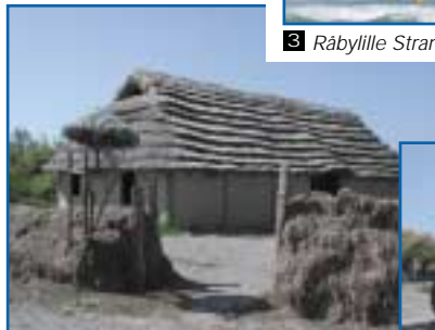
Tangdeich beim Projekt Steinzeitthaus