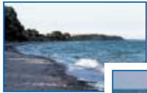
4 Hvide Klint