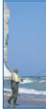
küstenangeln bei Møns Klint