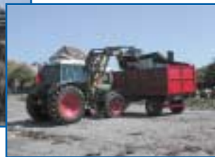
LIFE Projekt auf Møn - Umweltfreundliche Strandreinigung