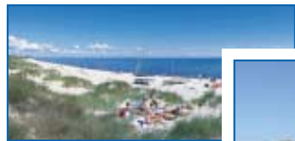
1 Ulvshale Strand