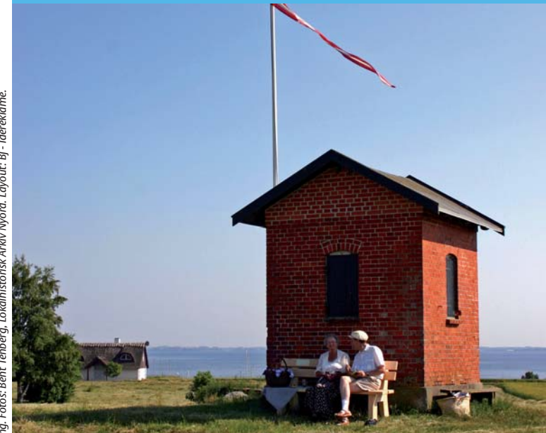
Ludjiver Møn Sydsjælland Turistforening i samarbejde med Nyord Lokalhistorisk Forening. Layout: Bj. Idereklame.